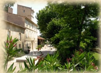
Le petit milord

LE VIEUX MAS D 15 ,1352 mas de végère30300 BEAUCAIRE /tel : 04.66.59.60.13/06.26.02.31.17