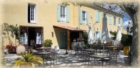
La Table de marguerite

Tous les menus sur www.vieux-mas.com /rubrique groupes adultes